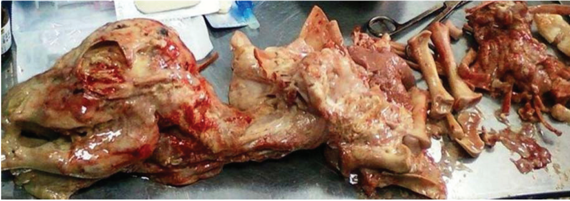
Şekil 1. Erken dönem fetal maserasyon