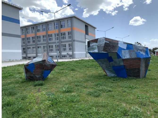
Görsel 9. Uygulama” Doğadan Bir Parça Form” Atatürk Üniversitesi

Plastik sanatlar içerisinde sanatçılar heykel uygulamalarını teknolojik atık metaller ile beraber her türlü atık metalden üretmektedirler. İnsan atığı olan atık metaller doğada, doğal biçimi bozarak telafisi olmayan çevresel felaketlere neden olmaktadır. Doğada biçimin bozulmasına neden olan atık metaller heykel uygulamalarında hem malzeme olarak hem konu olması açısından heykelin doğasında kendisini var etmektedir. Atık metallerin heykelde kullanılmasıyla sanatçılar, doğanın yok oluşuna, çevresel felaketlere, hem de metallerin heykelde kullanım avantajını bilerek malzeme olarak metali ve atık metalin durumundan faydalanarak uygulamalar yapmışlardır. Plastik açıdan atık metalin heykel içindeki renk biçim doku gibi plastik sanat değerlerini barındırması da heykele plastik açıdan katkı sağlamıştır.