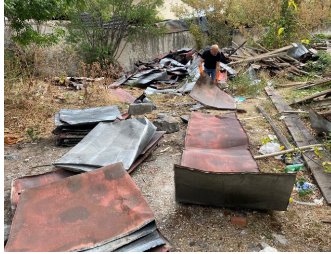
Görsel 8. Terk Edilmiş Evlerin Çatı Saclarının Sanat Nesnesine dönüşümü

Plastik sanatlar içerisinde sanatçılar heykel uygulamalarını teknolojik atık metaller ile beraber her türlü atık metalden üretmektedirler. İnsan atığı olan atık metaller doğada, doğal biçimi bozarak telafisi olmayan çevresel felaketlere neden olmaktadır. Doğada biçimin bozulmasına neden olan atık metaller heykel uygulamalarında hem malzeme olarak hem konu olması açısından heykelin doğasında kendisini var etmektedir. Atık metallerin heykelde kullanılmasıyla sanatçılar, doğanın yok oluşuna, çevresel felaketlere, hem de metallerin heykelde kullanım avantajını bilerek malzeme olarak metali ve atık metalin durumundan faydalanarak uygulamalar yapmışlardır. Plastik açıdan atık metalin heykel içindeki renk biçim doku gibi plastik sanat değerlerini barındırması da heykele plastik açıdan katkı sağlamıştır.