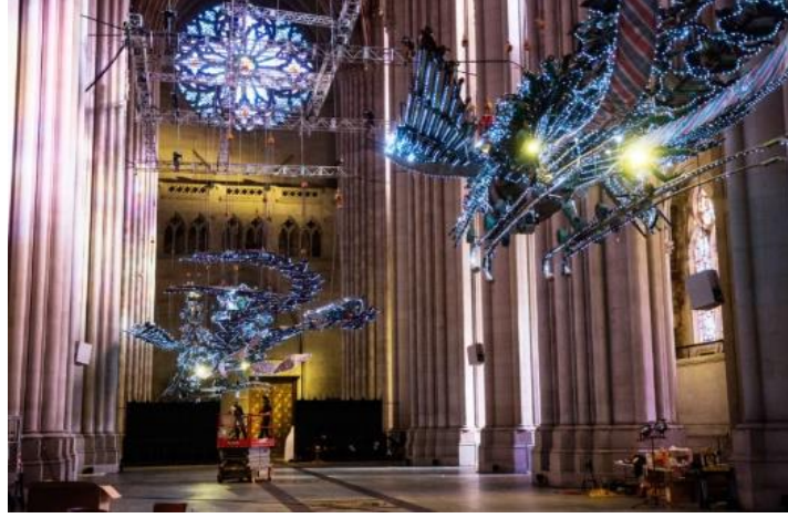
Görsel 4. Xu Bing, Phoenix, Cathedral of Saint John the Divine, New York, 2014