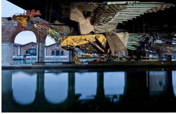
Görsel 2. Xu Bing, Phoenix, 56th Venice Biennale, Venice, Italy, 2015

“Proje Çin’in kültürel değişimini, modernizmini, hızlı büyümesini de içinde barındırır. Sanatçının farklı phoenix kurumları bulunmaktadır. Erkek phoenix Feng, yirmiyedi metre, dişi Huang otuz metredir. 2014 yılında New York City’deki St. John the Divine Manhattan Katedrali’nin nefine kurulmuştur. Mimari yapıya çeşitli merkezlerden sabitlenerek yerleştirilmiştir. Yerden yirmi metre yüksekliktedir.