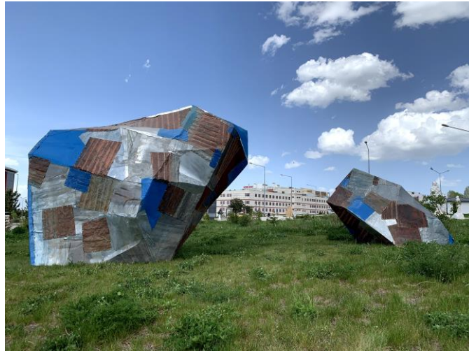
Görsel 10. Uygulama “Doğadan Bir Parça Form” Çalışmanın Bitmiş Hali

Toplumların aşırı tüketim kültürü içerisinde meydana gelen kültürel erozyona, çevresel kirliliğe, dikkat çekme amacı ile insanların duyarlılığını artırmak için çeşitli kurum, kuruluşların yönlendirmesiyle atıkların geri dönüşümüne yönelik projeler hazırlanmaktadır. Sorumluluk ve duyarlılık içerisinde atıkların geri dönüşümüne sanatsal bir dille yaklaşan sanatçılar geri dönüşüm kültürüne katkı sağlamak amacıyla heykeller yapmışlardır. Heykel uygulamaları yapan sanat icracıları bazen sadece atıklardan tesadüfi heykeller üretirken bazen de bilinçli olarak kavramsal ve biçimsel çözümlere ön eskiz oluşturarak tasarım yapmış uygulamalarını biçimsel bir dille kavuşturmuşlardır. Sanatsal yaratıma katkı sağlamak açısından ise belli bir konuya dikkat çekmek için içerisinde fikir barındıran, tarihsel bir geçmişi aydınlatan, kültürel değerlerden ilham alınarak sadece atık metallerle anlaşılanacak kurulumlar yapılmıştır.