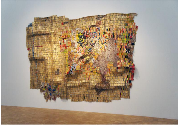
Görsel 5. El Anatsui, Topraksız Toprak, 2017

Ganalı sanatçı eserlerinin fikirsel oluşumunu Afrika'nın sömürgeleştirilmesinden ve Avrupa ile ekonomik alışverişinden, kültürel ve toplumsal olaylardan almaktadır.