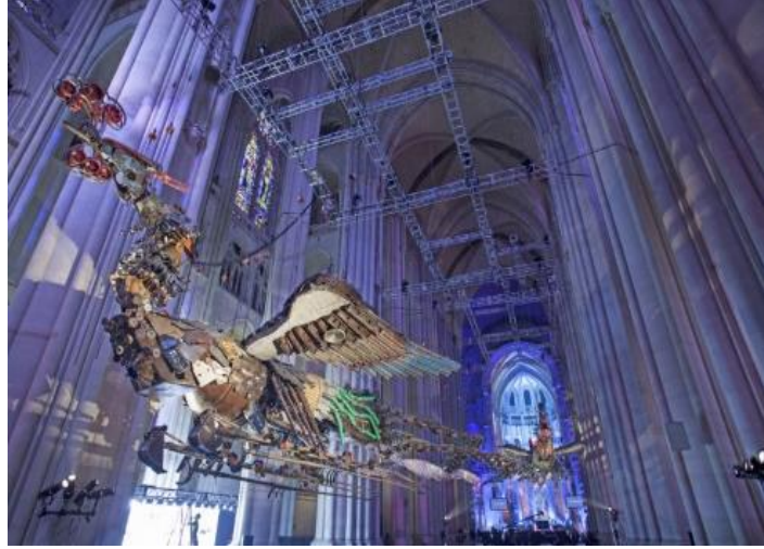
Görsel 3. Xu Bing Xu Bing – Phoenix, Cathedral of Saint John the Divine, New York, 2014

“Proje Çin’in kültürel değişimini, modernizmini, hızlı büyümesini de içinde barındırır. Sanatçının farklı phoenix kurumları bulunmaktadır. Erkek phoenix Feng, yirmiyedi metre, dişi Huang otuz metredir. 2014 yılında New York City’deki St. John the Divine Manhattan Katedrali’nin nefine kurulmuştur. Mimari yapıya çeşitli merkezlerden sabitlenerek yerleştirilmiştir. Yerden yirmi metre yüksekliktedir.