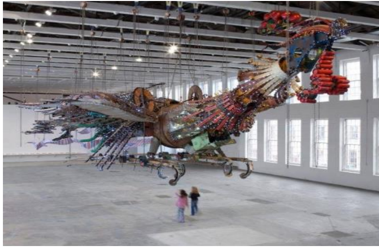
Görsel 1. Xu Bing, Phoenix, Mass Moca, Massachusetts, USA, 2013

çalışmalar yapmışlardır. Atık metaller ile yakın diyaloga giren sanatçılar atık metallerin çevresel zararlarına, teknolojinin başboşluğuna bazen sömürgeciliğe, az gelişmişliğe, yoksulluğa, kültürel yok oluşa, yolsuzluğa karşı sosyal konular üzerinde içerisinde fikir barındıran atık metallerden heykel uygulamalarıyla beraber kavramsal anlamda sanatsal üretim yapmışlardır. Uluslararası alanda farklı disiplinler üzerinde üretim yapan Xu Bing ve El Anatsui nin eserlerine bu makalede yer verilmiştir. Xu Bing için 2008 yılında Pekin'deki dünya finans merkezinin atriyumuna kalıcı bir proje yapması istenmiştir. Proje fikrinin anıtsal yapısını, fedakârlık, emek, yıkım, yenilenme ve umut oluşturmaktadır. Phoneix isimli çalışmayı kurgulamaya başlamadan önce hızlı gelişen Çin'in şantiyelerini dolaşarak gözlemlerde bulunmuştur. Zenginler için inşa edilen büyük yükselişlerin gerçekliği alt ve orta sınıf tarafından nasıl yapıldığı sanatçıyı etkilemiştir. Göçmen işçilerin çalışma koşullarını gözlemlemiştir. İyiyi, kötüyü, zenginleri, fakirleri bünyesinde barındıracak heykel projesinin temel fikrini oluşturmuştur.