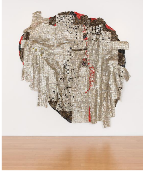
Görsel 7. El Anatsui (Gana), Ter Kanı, Alüminyum ve bakır tel, 330 x 280 cm. 2015